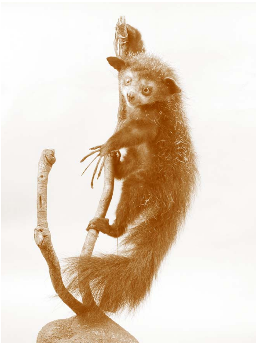
Мадагаскарская руконожка (из собрания Государственного Дарвиновского музея в Москве)